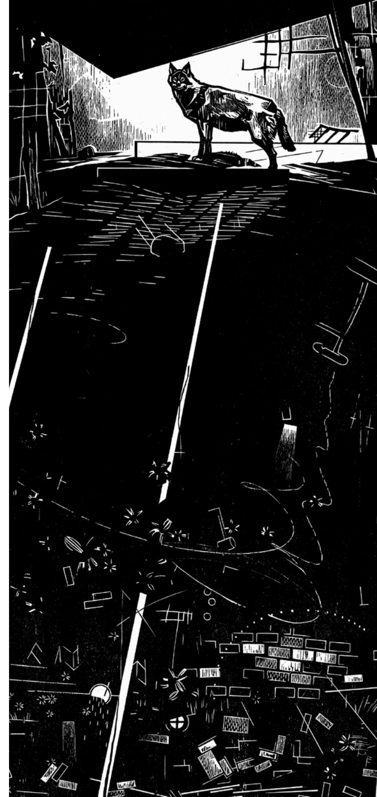
ganz oben: Mäuse , 2023, Holzschnitt, Druckmaß 67×97 cm oben: Regenschwan mit Katzen , 2022, Holzschnitt, Druckmaß 67×97 cm rechts: Wolf , 2019, Holzschnitt, Druckmaß 80×43 cm Titel: Der erste Stein , 2020-21, Holzschnitt, Druckmaß 120×60 cm Mitte unten: Franca Bartholomäi